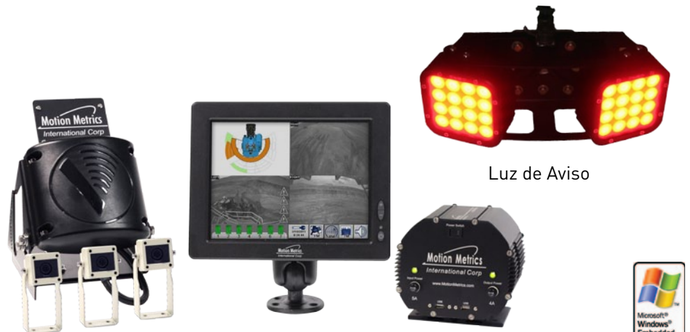
Sistema ViewMetrics™ & RadarMetrics™

O sistema RadarMetrics™ divide uma plataforma comum com os sistemas ToothMetrics™ e FragMetrics™ e pode ser combinado para fornecer uma solução completa de monitoramento da escavadeira por uma fração do custo. Os três sistemas são perfeitamente integrados em uma única interface gráfica.