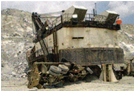
Cobertura completa dos pontos cegos