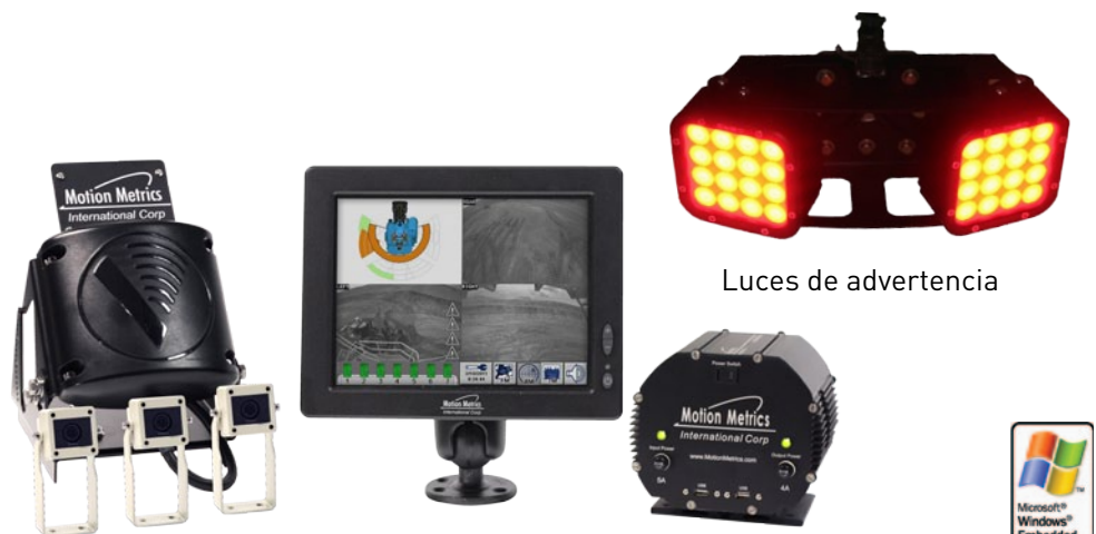
Sistema de ViewMetrics™ & RadarMetrics™

El sistema ViewMetrics™ comparte una plataforma común con los sistemas ToothMetrics™ y FragMetrics™ y pueden ser combinadas para proporcionar una completa solución de monitoreo en la pala con costo compartidos. Los tres sistemas están perfectamente integrados en una sola interconexión gráfica intuitiva.