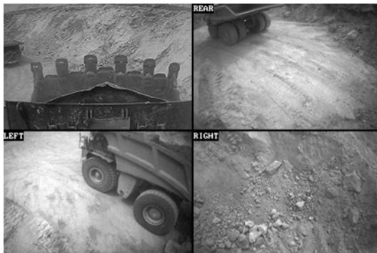
Vistas integradas de vigilancia